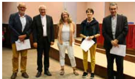
Traditionnelle remise des diplômes

*C = Crédit : 1 crédit correspond à 25 heures de travail en moyenne (cours, lectures, travail personnel, révisions, examens...). Ces crédits acquis à l'INSR sont susceptibles d'être transformés en ECTS (European Credits Transfer System) pour les personnes qui valident un parcours universitaire dans le cadre de l'accord avec l'IER.