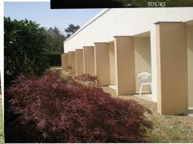
Monastère ste Claire 24 Bis rue du Pas-Notre-Dame 37100 TOURS 02.47.54.38.49 soeursclarisses.tours@orange.fr